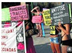
Un grupo de prostitutas en una manifestación.

La presión policial que, según el Ayuntamiento de Málaga, se está ejerciendo sobre aquellos que solicitan servicios sexuales en la vía pública ha provocado una drástica bajada de la prostitución callejera en el último año. Así, los agentes han impuesto un total de 138 sanciones entre enero y abril, frente a las 560 contabilizadas en el mismo periodo del ejercicio anterior, según los datos proporcionados por el Consistorio.