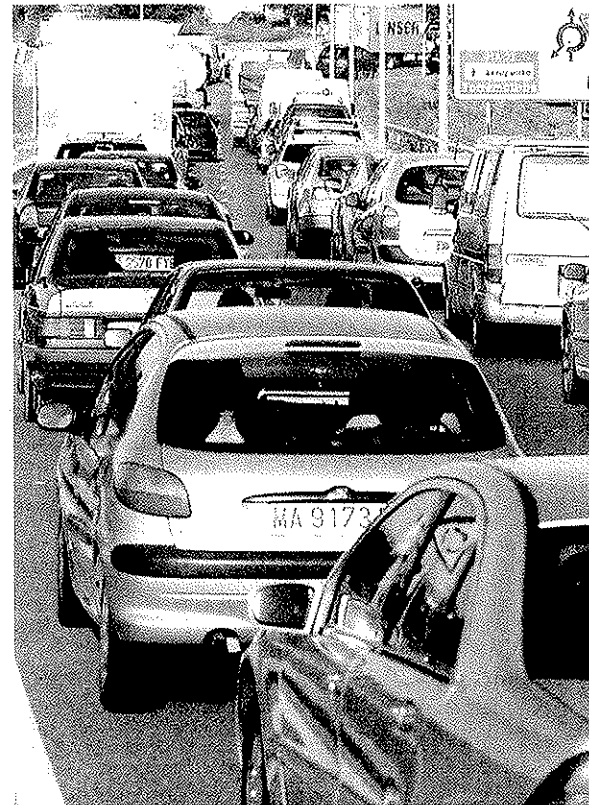
Miles de vehículos se vieron atrapados en la mañana de ayer en los accesos

Este periódico pudo comprobar ayer que no había obrero alguno en esta parte de las obras, a la que el Ayuntamiento tuvo que inyectar un millón de euros más para cubrir la aportación que iban a realizar los promotores de un parque empresarial en lo que fueron los terrenos de Hitemasa, un proyecto paralizado por la crisis. Se ha realizado un muro para ampliar la carretera a la anchura necesaria para habilitar dos carriles por sentido, pero las obras están paradas. En teoría, deberían haber concluido el pasado 31 de diciembre, plazo máximo para culminar los proyectos