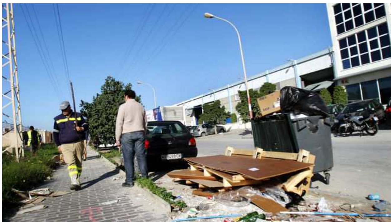
Una calle del polígono Guadalhorce, en una imagen de archivo.

REDACCIÓN MÁLAGA, 17 MARZO, 2017 - 17:08H