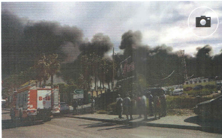
Uno de los vehículos del Real Cuerpo de Bomberos de Málaga en el lugar del incendio

La sala de coordinación pidió ayuda a efectivos que no estaban en activo, que conformaron tres grupos de trabajo adicionales para garantizar el resto de servicios en la ciudad